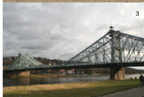
1. Übigauer Drehkran – 2. Gohliser Windmühle – 3. Blaues Wunder

Ausstellungsräume der Bürgerinitiative Schloss Übigau e. V. Eingang neben Werftstraße 1