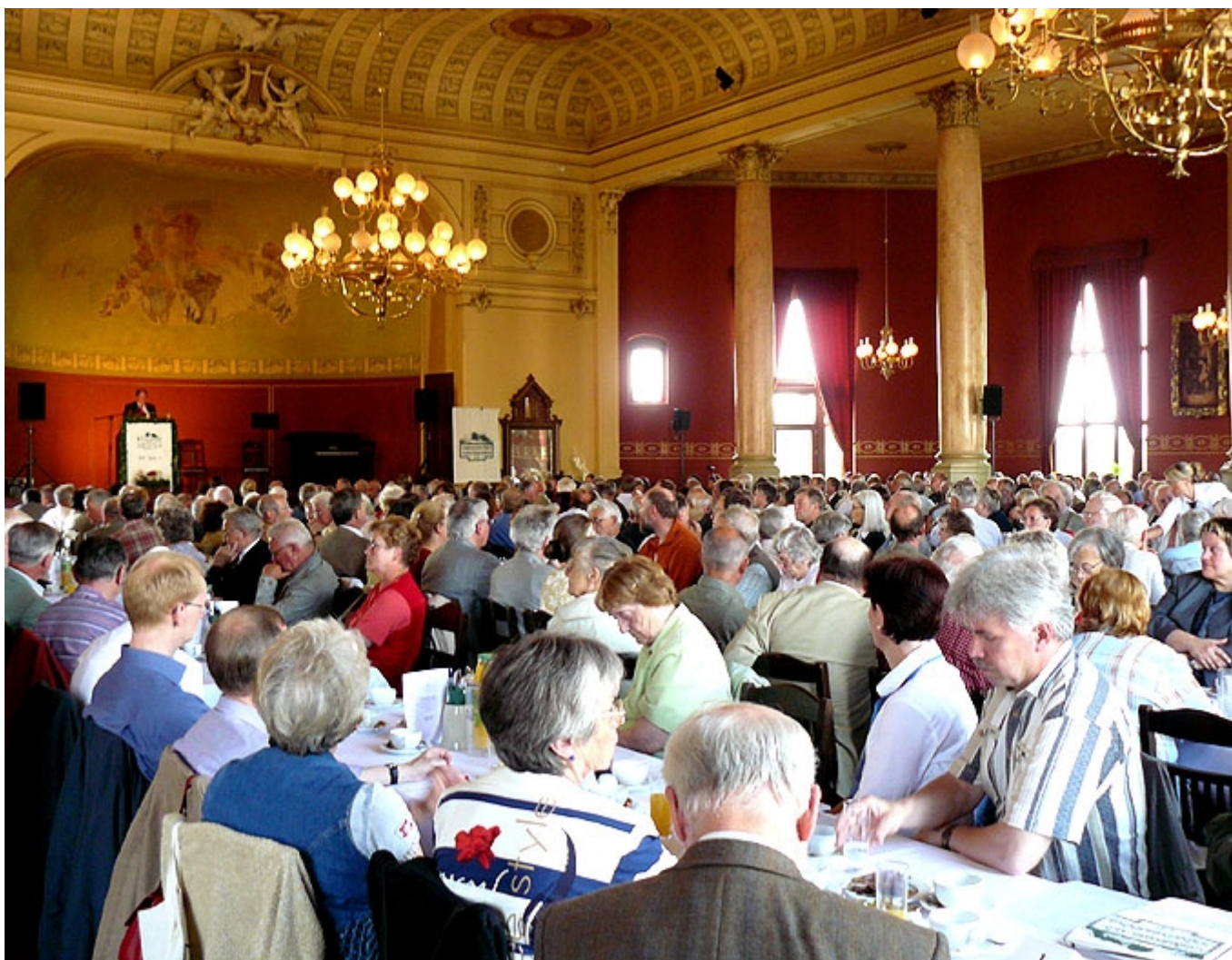
Blick in den Ballsaal während der Festveranstaltung